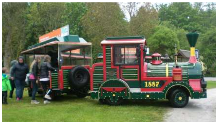
Tuff-tuff-tåget vid Polhemsgården på Tingstädedagen