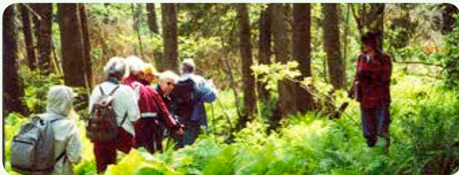
Guidade visningar och vandringar