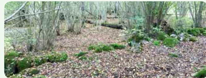
Sveriges främsta odlingslandskap från järnåldern. Omfattande och välbevarat.