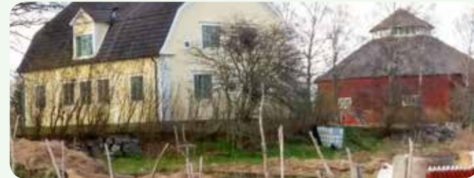
Torp och gårdar