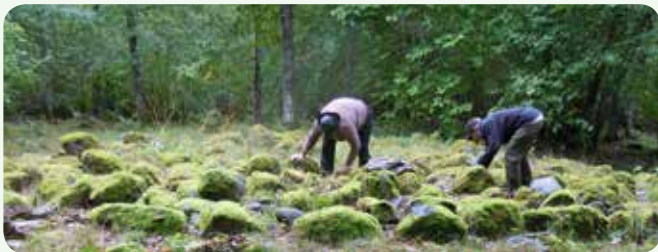
Adoption av fornlämningar