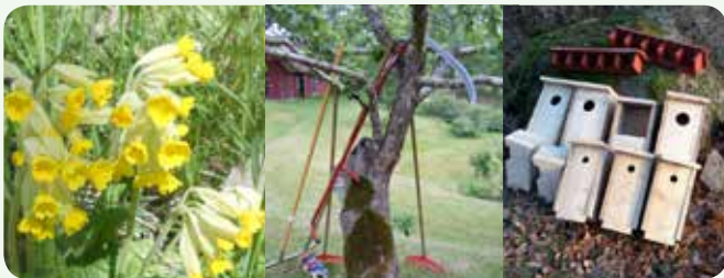
Vård av torpet Fröberget, fagning, slåtter och naturvård