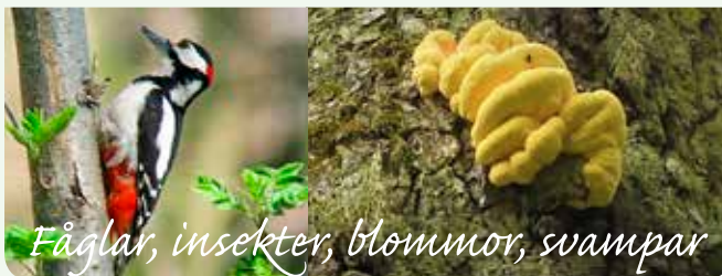
Fåglar, insekter, blommor, svampar