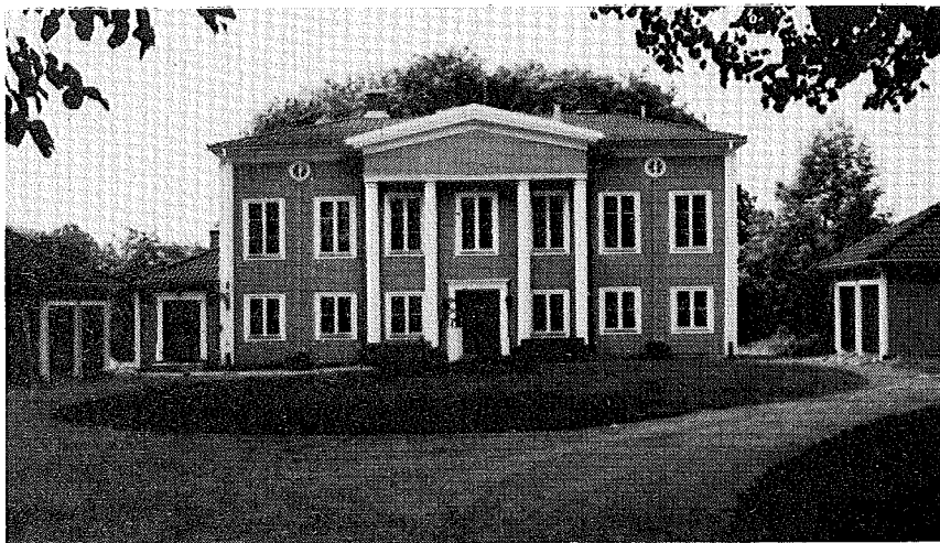
Södra Åreda herrgård