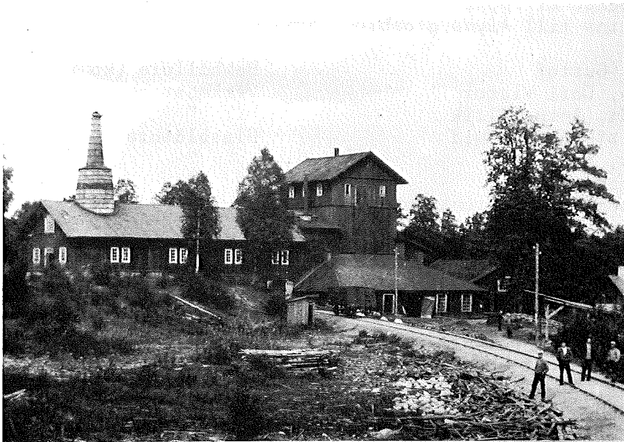
Masugnsanläggningen vid början av 1900-talet med stickspåret till Åryds järnvägsstation

I Åry Bruks arkiv förvaras ett kontrakt daterat den 26 augusti 1912, där fabriker Oscar Nelson i Hovmantorp av Tingstads Trävaru Aktieföretag, ägare av Åry Bruk, från den 1 september 1911 "arrenderar den å Åry Bruk i Åryd befintliga, oss tillhörande masugnsbyggnaden jämte ett sydost därom varande jordområde, hvars gränser utgöres i öster af Åry-sjön från byggnadens norra gavel till afloppsdiket, som sålunda utgör gräns åt sydväst. I vester utgöres gränsen af bruksvägen till Stationen samt i norr af en intill masugnsbyggnaden befintlig å."